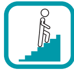
Treppe statt Aufzug